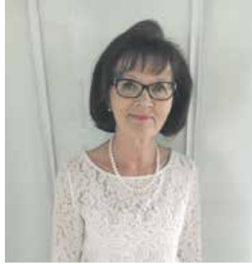
Kouvolassa Aglow työstä vastaa

On tärkeitä myös vaihtaa ajatuksia elämän perusarvoista ja tarkoituksesta sekä kuulla raamatullista opetusta. Tavoite on ollut rohkaisu ja eteenpäin meno. Moni nainen on virkistynyt ja saanut hengellistä ravintoa illoissa.