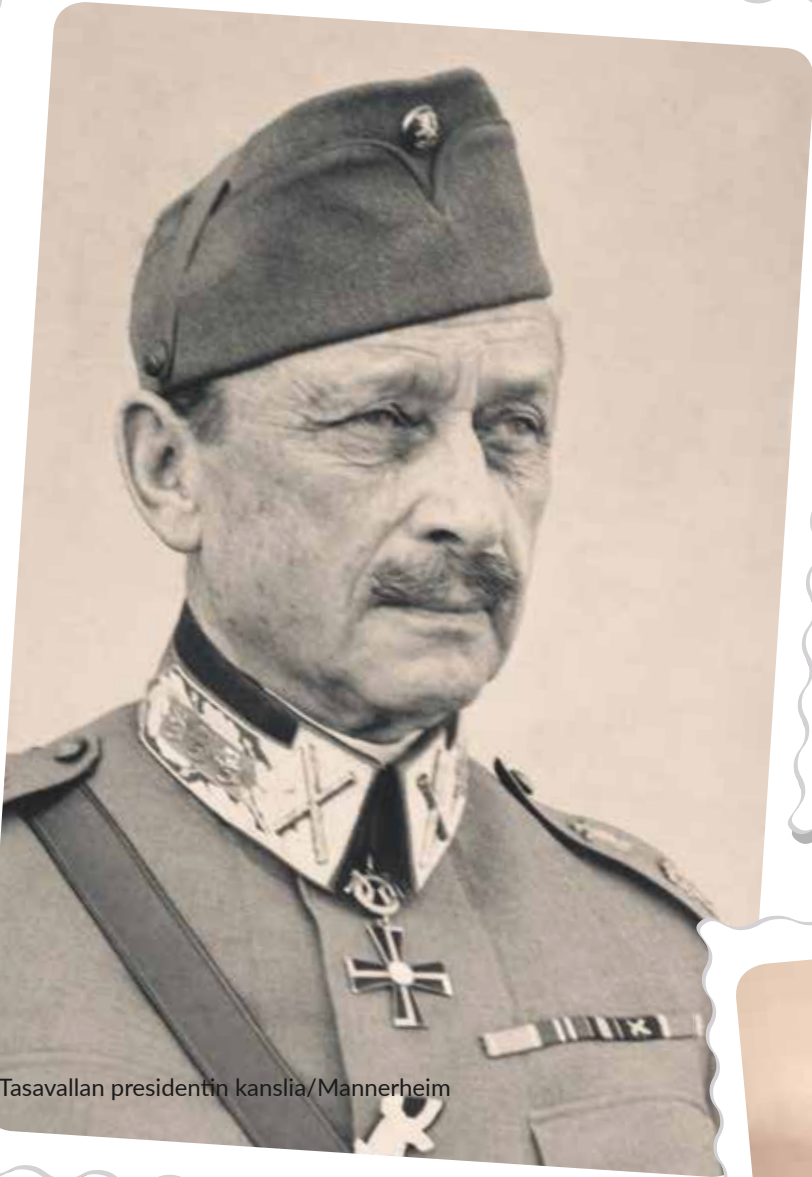
Tasavallan presidentin kanslia/Mannerheim