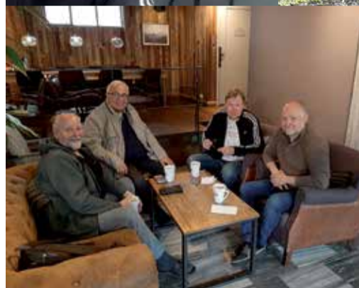
Teksti ja kuvat: Ismo Valkoniemi