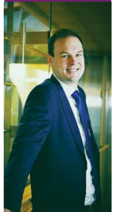
Ville Kaunisto kansanedustaja

sen syntymäpäivää, iloista kohtaamista joulupukin kanssa tai ihan kaikessa rauhassa palavaa joulukynttilää. Pientä hetkeä, jossa murhe unohtuu ja tulee voimaannuttava ajatus, että kylä me tästäkin selviämme.